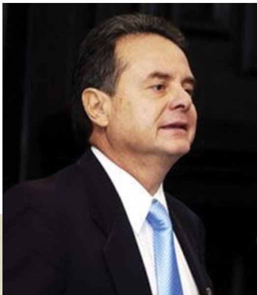
La ceremonia fue encabezada por el Secretario de Energía, Lic. Pedro Joaquín Coldwell.

El C. P. Francisco Rojas Gutiérrez tiene una larga trayectoria en el sector público y energético de nuestro país, en donde ha desempeñado, entre otras, las responsabilidades de Secretario de la Contraloría General de la Federación, Director General de Petróleos Mexicanos y diputado federal.