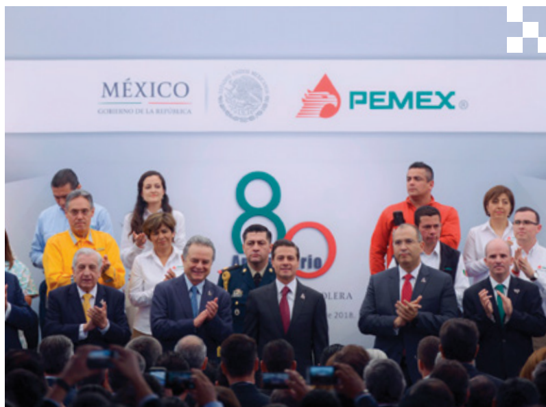
Al día de hoy se tienen 16 proyectos en asociación con 15 empresas de clase mundial que están proyectando invertir, junto con Petróleos Mexicanos, alrededor de 300 mil millones de pesos.

Refirió que las alternativas pasan por cancelar o preservar la libertad de los consumidores de elegir entre distintas opciones; de regresar a un modelo cerrado o privilegiar la apertura y la